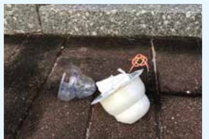
鏡餅もお持ち帰りください。