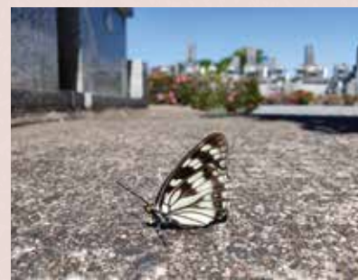
ゴマダラチョウ(梅区)

山々に囲まれた当苑には、毎年たくさんの生き物たちがやってきます。自然と隣り合わせである以上、シカやイノシシによる食害や、ハチやクモなどの巣による被害はある程度避けられないものですが、同時に我々が自然と共存することの大切さを考えさせられる機会にもなります。さて、今回はそんな当苑の魅力を知っていただくため、春から秋にかけて苑内で観察できる美しい蝶たちを一部ご紹介させていただきます。当苑に眠られている方々の安らかな平穏を祈るとともに、この場所で力強く生まれ来る新たな命に想いを馳せていただければ幸いです。