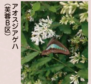
アオスジアゲハ (芙蓉B区)

この他にも、写真で紹介しきれなかった蝶たちが植栽の周囲を飛び回っているのを見つめることができます。皆様のお参りがより心地よいものになることを願っております。