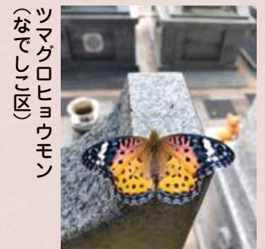
ツマグロヒョウモン (なでしこ区)