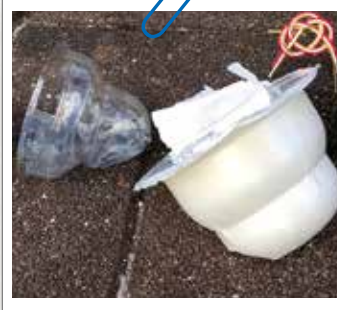
鏡餅もお持ち帰りください。

近 年、シカやカラスなど野生動物による生花の食害が発生しております。食べ物や紙パックのお供え物を置いたままにされますと、カラスや動物の餌となり墓所を荒らされてしまいます。お供え物はお参りが終わりましたら全てお持ち帰りいただくようお願い致します。現在、柵の設置や忌避剤の散布などの対策を行っておりますので、皆様のご理解とご協力をお願い致します。尚、供物は職員の巡回時に回収させていただいております。